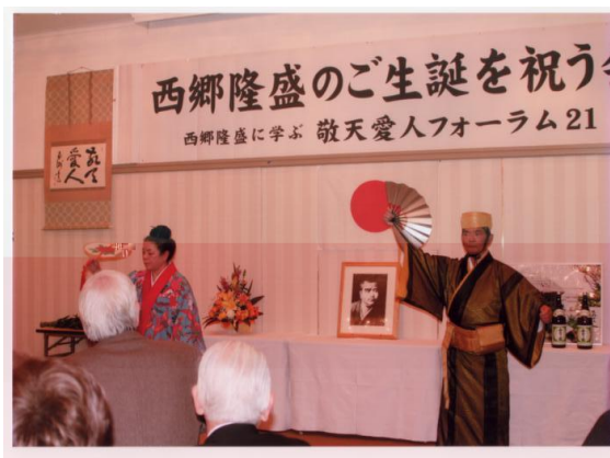
オープニング 御前風