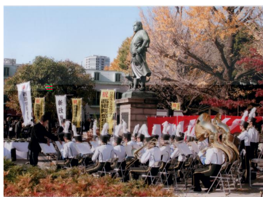
神奈川大学吹奏楽部