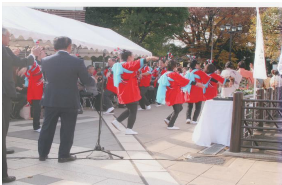
鹿児島おはら踊り