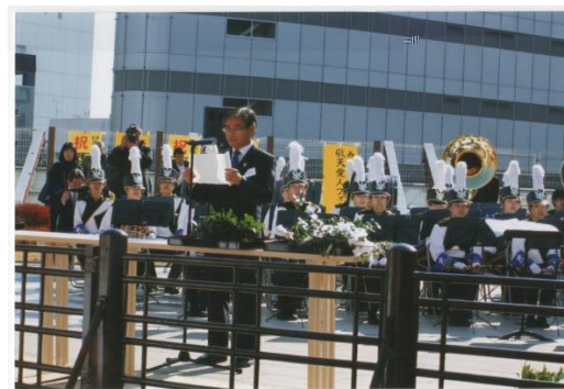
祭文奏上 内 弘志