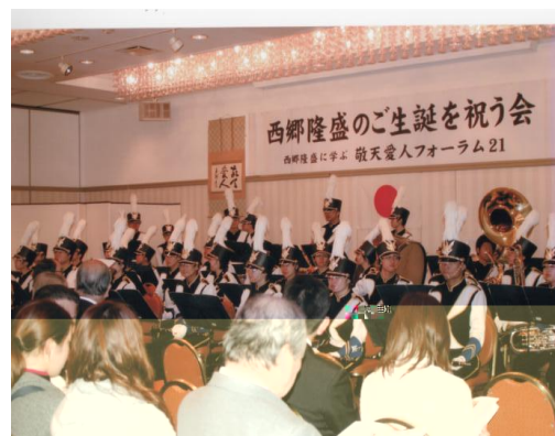
神奈川大学吹奏楽部